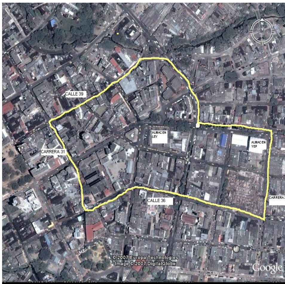
Figura 1. Demarcación del área de investigación en la zona central de la ciudad de Villavicencio. Enero 2007